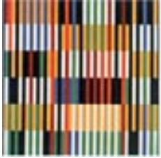
Richard Paul Lohse